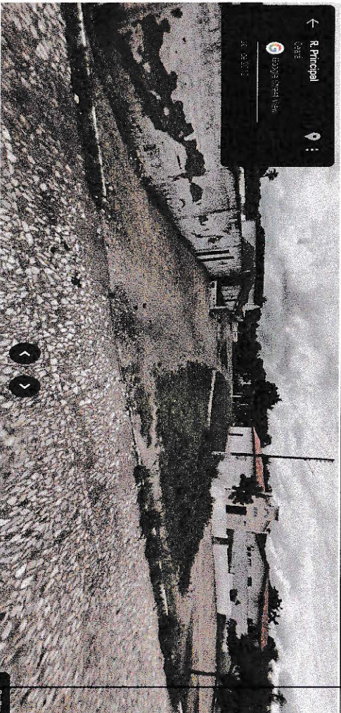
Início da travessa (Rua Principal, Estádio local, Igreja Batista)