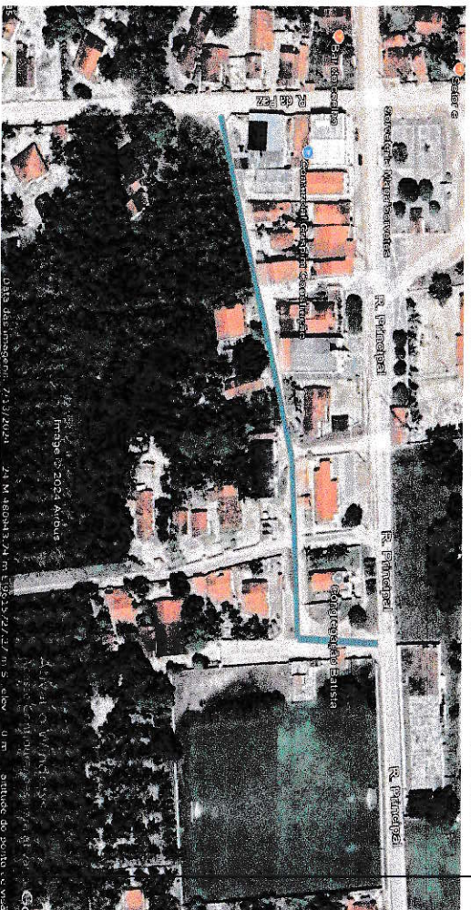
Vista Aérea da localização da travessa